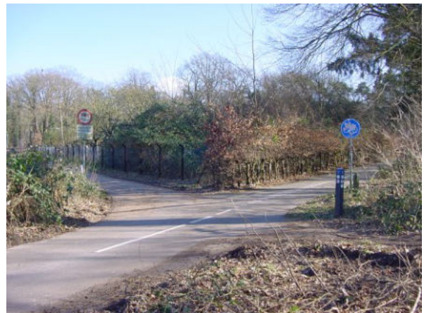
Heidepark (C1) – fietspad (G11), 16-02-2025