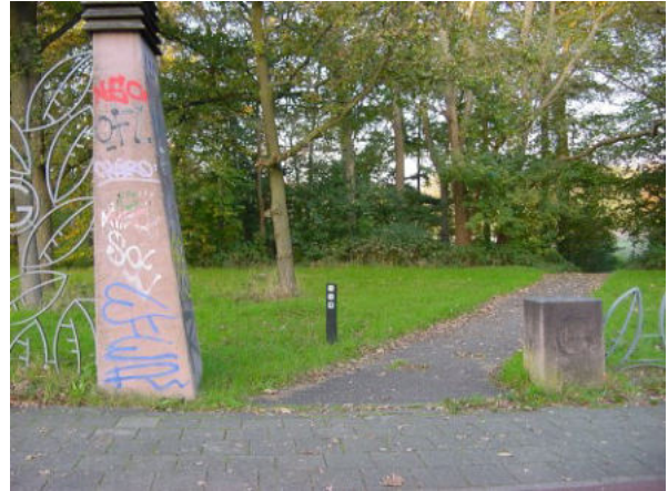
Bladerpoort Goffertpark, graffiti, 05-11-2024