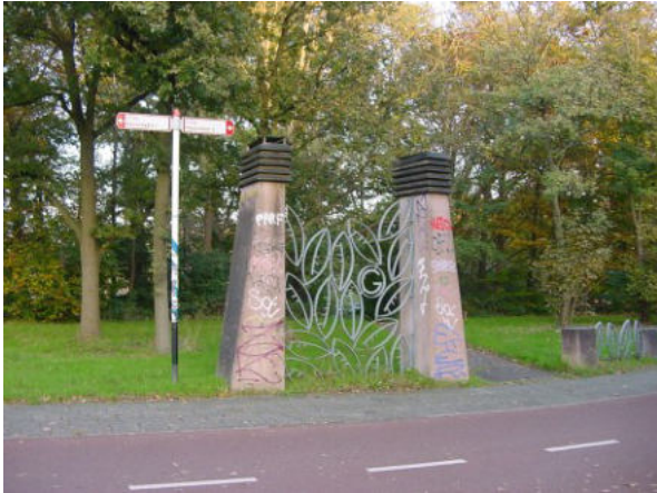
F173b, Bladerpoort Goffertpark, graffiti, 05-11-2024