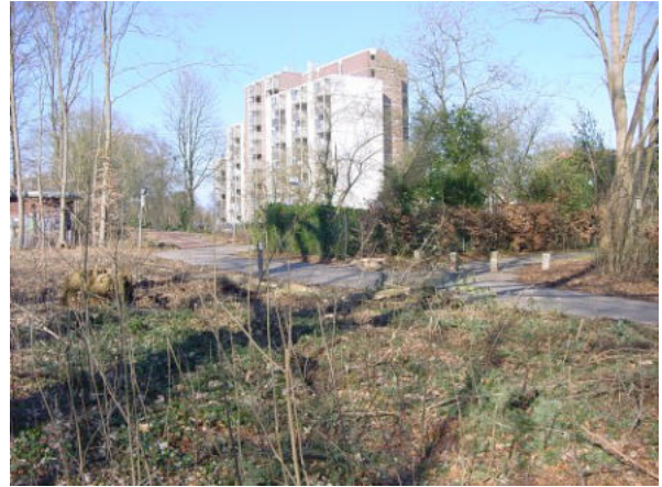
z.g. Wigwamweg (achter paaltjes), 16-02-2025