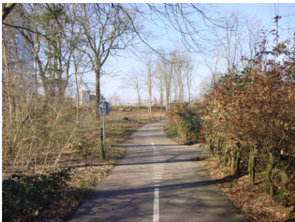
verplicht fietspad (G11), 16-02-2025