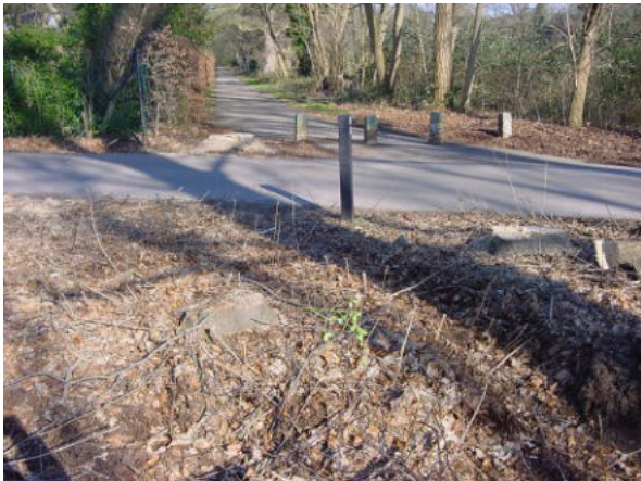
z.g. Wigwamweg (achter paaltjes), 16-02-2025