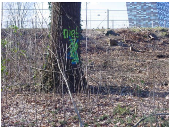
niet verwijderd, 16-02-2025