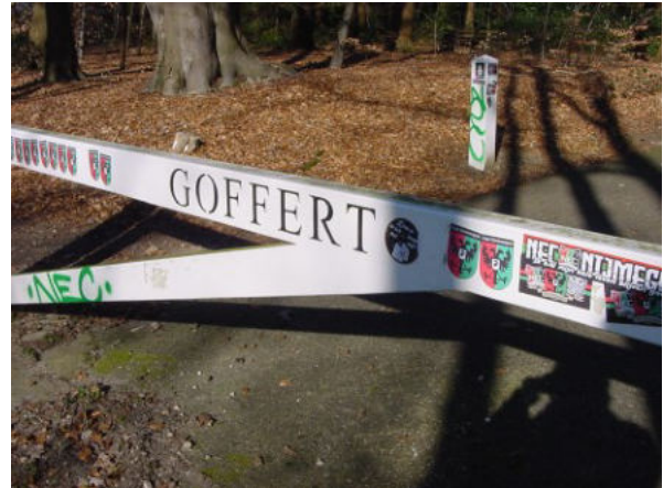
onjuiste naam, graffiti, 16-02-2025