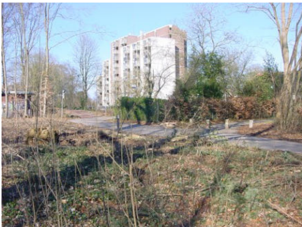
z.g. Wigwamweg (achter paaltjes), 16-02-2025