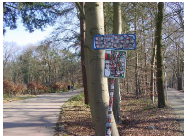
onverplicht fietspad (G13), graffiti, 16-02-2025